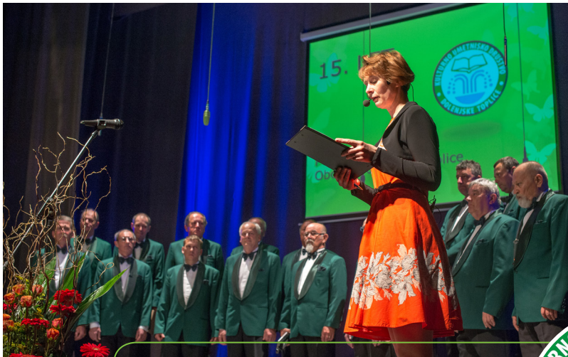
Gostje večera MPZ Medvode KUD Simon Jenko