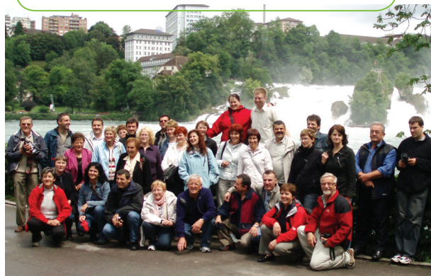
Ob Renskih slapovih, Švica (l. 2010)

V 10 letih delovanja zboru se je zvrstilo natančno 131 nastopov. Ljubezen do glasbe je v tem zboru razvijalo 32 pevcev, in to zelo uspešno, saj se je zbor leta 2010 prvič uvrstil na regijsko revijo pevskih zborov Sozvočja, ki je potekala novembra 2010 v Krškem. To je bilo veliko priznanje za pevke, pevce in zborovodjo ter občino, ki smo jo zastopali. Zbor je svoje znanje in pesmi predstavil tudi v tujini, in sicer v Švici. Tistega leta so izvedli 21 nastopov, od tega kar 2 v tujini. Objavljenih je bilo več novic v Glasilu občine Dolenjske Toplice (februar, junij, julij 2010).