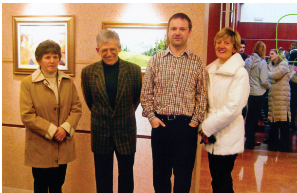
Slikarska razstava domačih likovnih ustvarjalcev v KKC (ob kulturnem prazniku 2007)

Že za kulturni praznik leta 2007 je bila pred uradno otvoritvijo KKC v avli postavljena slikarska razstava domačih ljubiteljskih slikarjev. Sledile so skupinske razstave ob kulturnih praznikih.