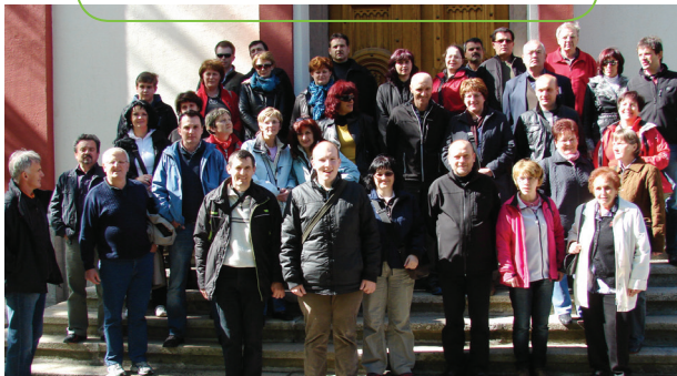
V Rekovcu v Srbiji (21.04.2012)