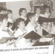
Topičski pevci in pevke po področnem letu doravnajo