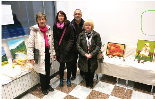
Razstava članov likovne sekcije v Sarajevu (2014)

Oktoberja je bila postavljena prva priložnostna skupinska razstava članov v tujini (v Sarajevu).