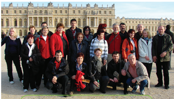
Člani MePZ v Parizu (11.11.2011)