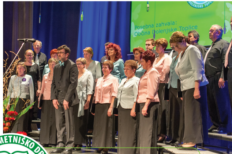
MePZ Dolenjske Toplice