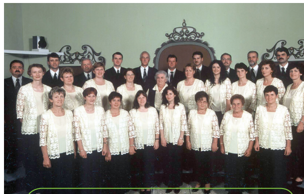
Prva uradna fotografija MePZ KUD Dolenjske Toplice (2002)