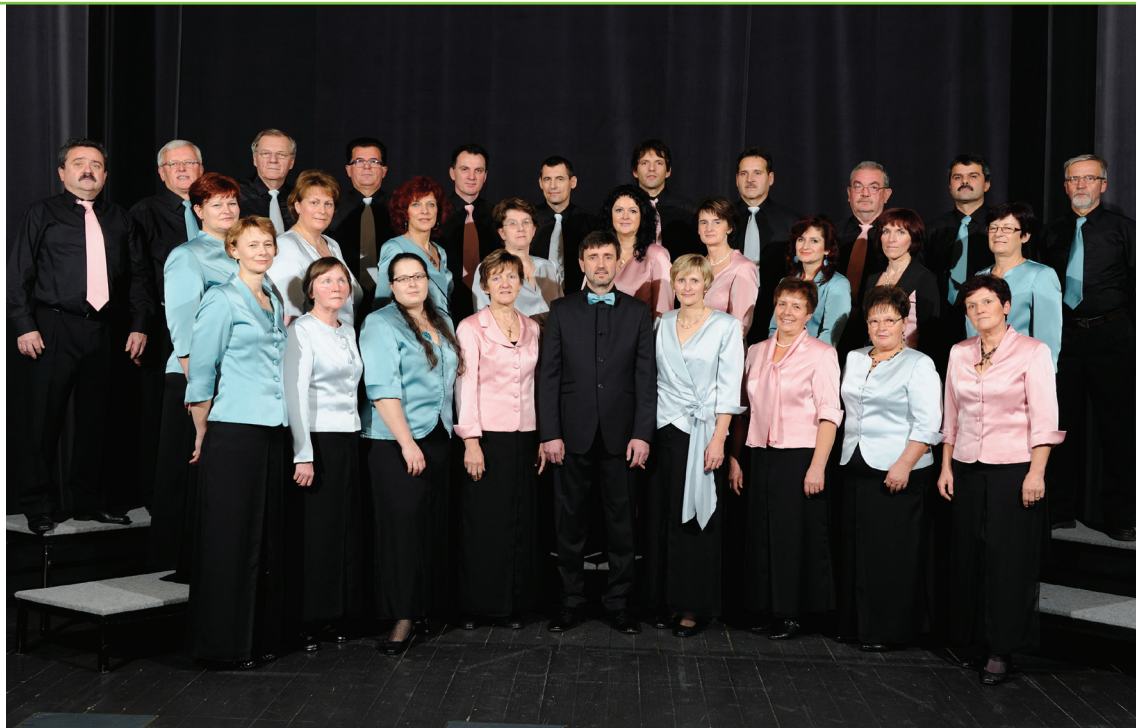
Mešan pevski zbor KUD Dolenjske Toplice