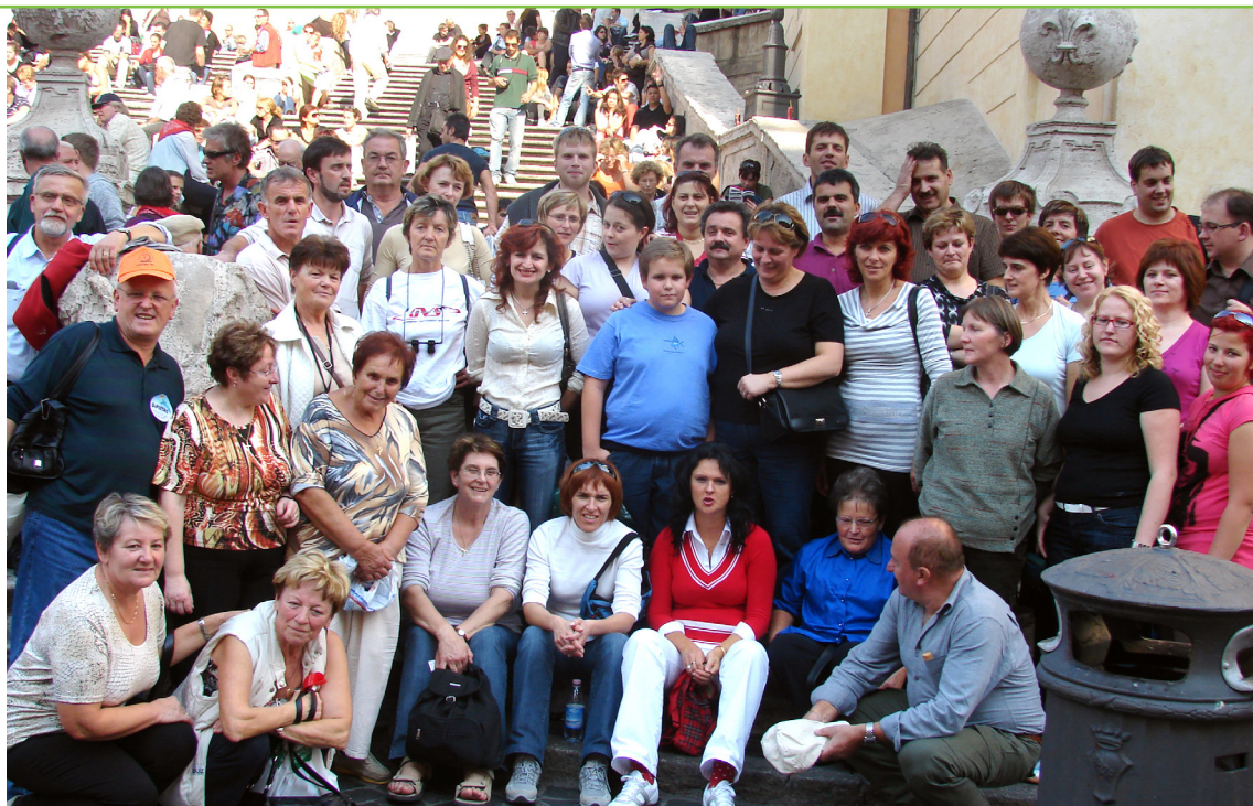
MePZ na enem od nastopov v tujini I. 2008 (znamenite Španske stopnice v Rimu)