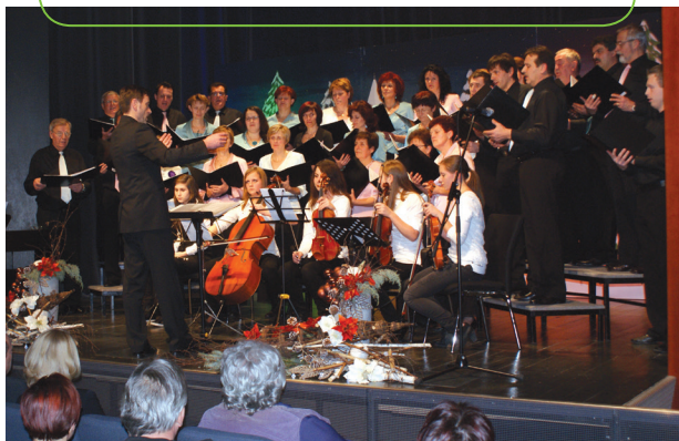
Božično-novoletni koncert z instrumentalisti

V 10 letih delovanja zboru se je zvrstilo natančno 131 nastopov. Ljubezen do glasbe je v tem zboru razvijalo 32 pevcev, in to zelo uspešno, saj se je zbor leta 2010 prvič uvrstil na regijsko revijo pevskih zborov Sozvočja, ki je potekala novembra 2010 v Krškem. To je bilo veliko priznanje za pevke, pevce in zborovodjo ter občino, ki smo jo zastopali. Zbor je svoje znanje in pesmi predstavil tudi v tujini, in sicer v Švici. Tistega leta so izvedli 21 nastopov, od tega kar 2 v tujini. Objavljenih je bilo več novic v Glasilu občine Dolenjske Toplice (februar, junij, julij 2010).