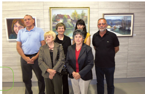
Razstava članov likovne sekcije v Straži (2014)

Novembra so člani izpeljali organizacijo slikarske razstave ULAK iz Karlovca, z naslovom KUPA – KOLPA ART. Skupinska razstava članov likovne sekcije v domači občini je bila izpeljana decembra, ob izvedbi 15. koncerta MePZ v KKC z naslovom Zimske podobe.