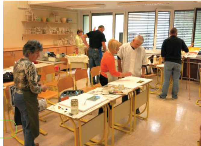
Delavnica v osnovni šoli

Likovna sekcija s svojim delom bogati kulturno življenje v topliški dolini.